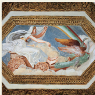
Camera dei Venti (particolare)