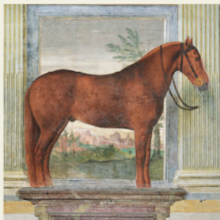
Sala dei Cavalli (particolare)