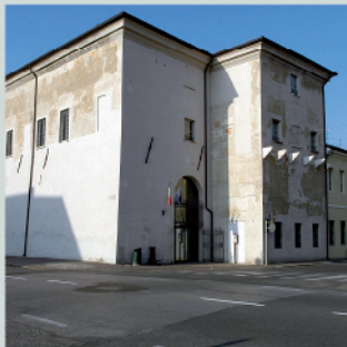
Palazzo San Sebastiano