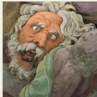
Sala dei Giganti (particolare)