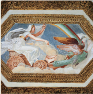
Camara de los Vientos (detalle)