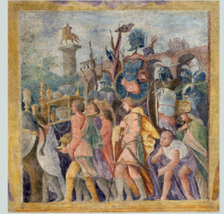
Los triunfos del César , de Andrea Mantegna, fresco recuperado