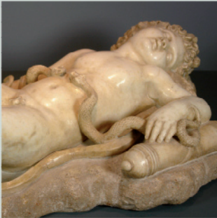
Cupido dormiente (detalle)